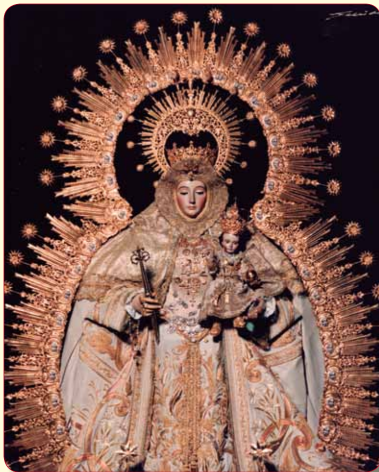
Nuestra Señora del Valle, luciendo el rostrillo.

Esto hizo que muchas hermandades se planteasen poco a poco el dejar de lado influencias de las dolorosas que habían contaminado el estilo letífico para presentarlo tal cual era: esto es lo que ocurre en esta época en La Palma del Condado con la Virgen del Valle, cuando con mucho acierto, se decide la eliminación del rostrillo para presentarla de nuevo tal y como había estado desde que se tiene constancia gráfica hasta la aparición de esta prenda, volviendo a su ser la elegante y distinguida estampa de la imagen (el rostrillo se quita por primera vez en el primer traslado de la Virgen de julio de 1994). Naturalmente, esto generó controversia, ya que como hemos dicho, el pueblo la había contemplado durante casi cincuenta años con rostrillo y al eliminarlo causó extrañeza en los devotos. Es por ello, que actualmente se alternan con mucho acierto los dos modos de presentar a la Virgen del Valle (con y sin rostrillo), por lo cual opinamos que todo el mundo ha salido ganando, ya que por un lado se ha recuperado la iconografía tradicional mientras que por otro, se ha conservado la que ha tenido durante la segunda mitad del siglo XX hasta el final del mismo.