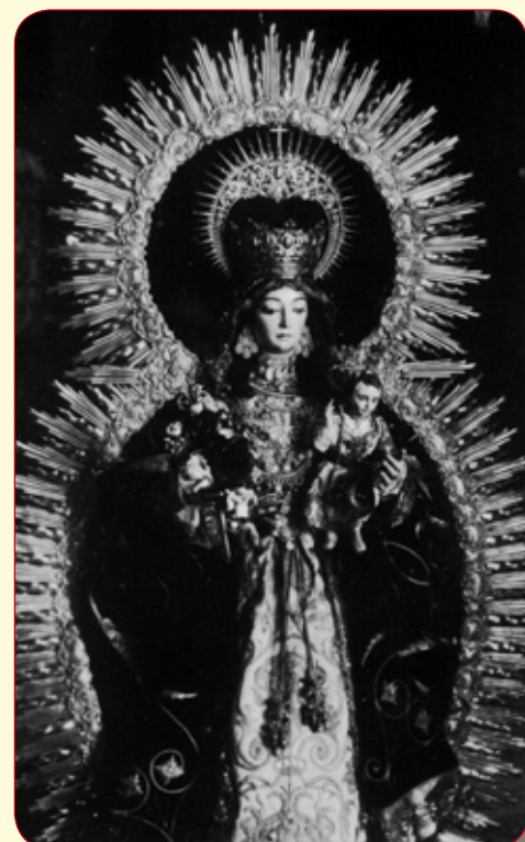
“La Morenita”. Imagen de Ntra. Sra. del Valle desaparecida en los sucesos de la Guerra Civil el 18 de julio de 1936.

La anterior imagen de la Virgen del Valle, conocida popularmente como “La Morenita”, era de vestir y se encontraba de pie portando al Niño en su mano izquierda, mientras que en la derecha sostenía un ramo de flores. Llama la atención la frontalidad y el hieratismo de la misma que le otorgaban un aspecto majestuoso, los ojos almendrados, las cejas arqueadas, la boca cerrada y la mano izquierda abierta y la derecha levemente cerrada, no son rasgos propios de la escultura decimonónica (etapa en la que se estima comienza a venerarse en La Palma), sino bastante anterior, puesto que todas estas características nos remiten a modelos propios de principios del siglo XVII.