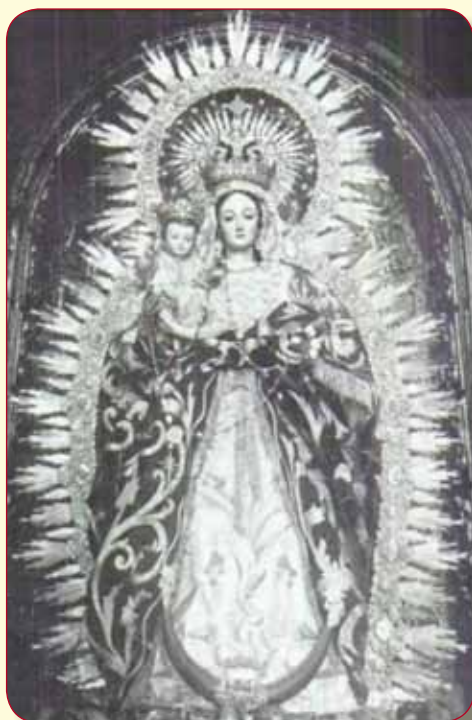
Virgen del Rosario, Iglesia Santa Catalina (Sevilla).