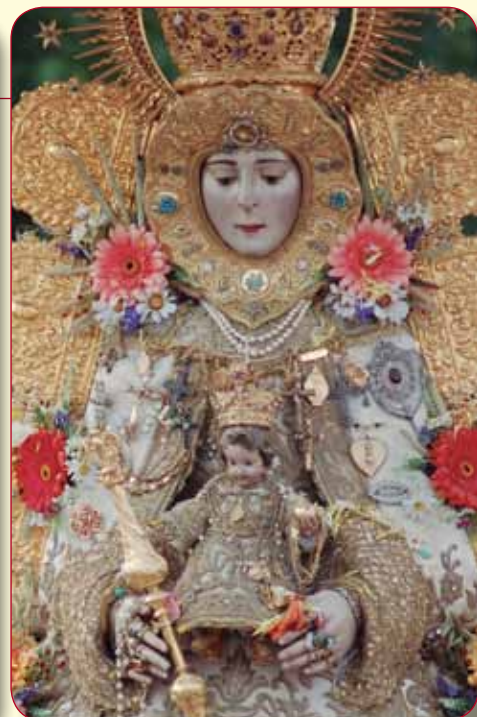
Virgen del Rocío, Patrona de Almonte (Huelva). Está vestida a la moda de los Austrias, como gran dama de la corte.