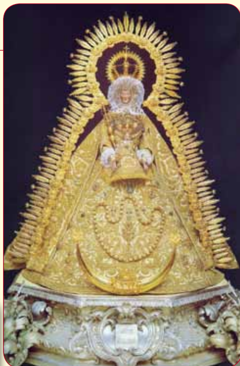
Virgen de Gracia, Patrona de Carmona (Sevilla). Revestida con el traje bordado en oro y perlas de 1649, se corresponde en su tipología a la vestimenta de la corte de Felipe II.