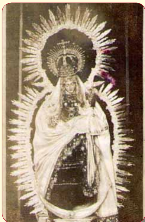
Virgen del Amparo, Iglesia de la Magdalena (Sevilla).

De tal forma, ésta fue la imagen que llega hasta 1936 y que por lo tanto, condiciona el aspecto de la actual que heredó precisamente todos los rasgos que comentamos, si bien dulcificados al reinterpretarlos Sebastián Santos Rojas.