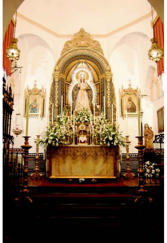
Cultos Aniversarios Imagen y Coronación. 22-25 de octubre.