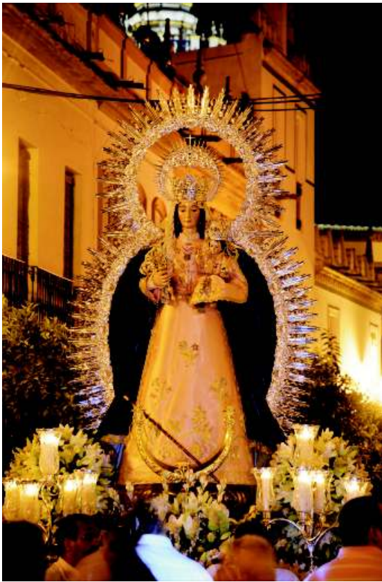
Traslado a la Iglesia Parroquial. 28 de julio.