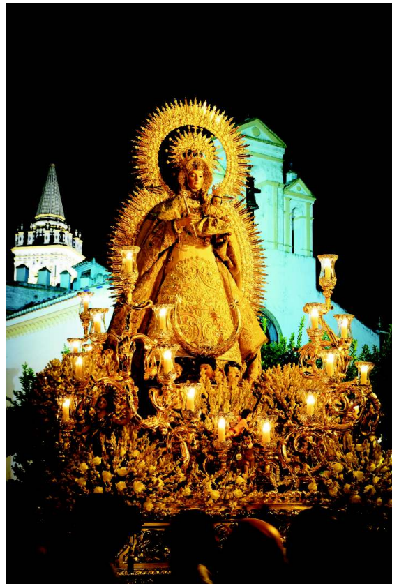
Tradicional Rosario de Doce. 16 de agosto.