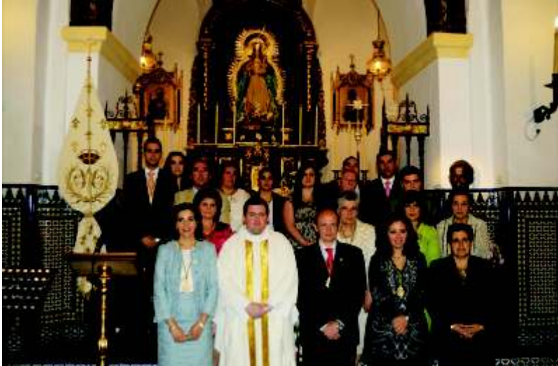
Toma de posesión de la nueva junta de gobierno.

¿Vale la pena?, el pecado ha oscurecido el