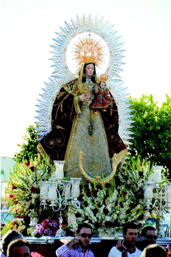
Traslado a la Iglesia Iglesia del Valle. 26 de agosto.